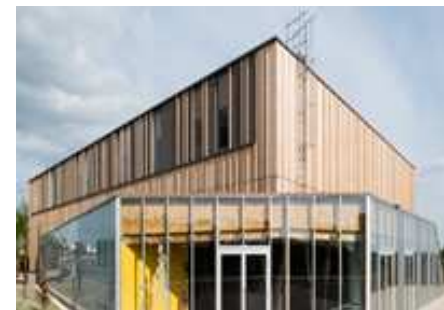
Complexe omnisports Sainte Maure de Touraine - Archi : Bourgueil & Rouleau

14h00—Etat de la réglementation : IT 249 et guides d'application