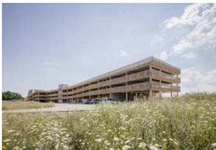
Photo Parking des Bohries - Archi : Jourda Architectes Paris